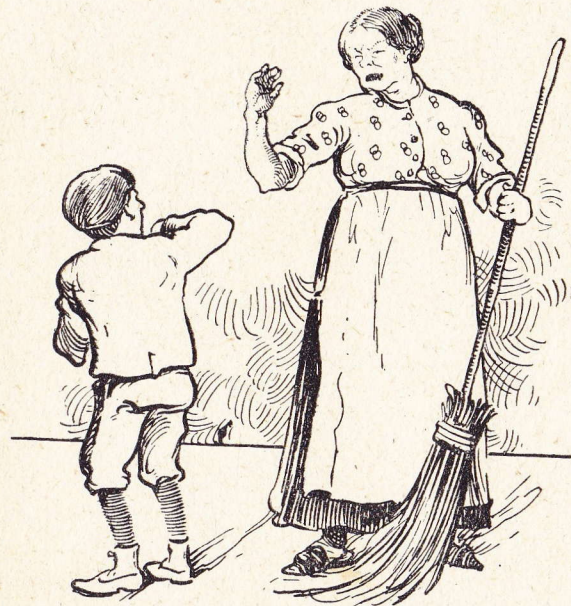
Is me dat een lawaai?

— „Is me dat een lawaai!” schreeuwde eene vrouw, die een bezem in de hand hield. Daarmee had ze Jef den klap gegeven. „'t Is eene schande, om een mensch zoo te doen verschrikken,” gromde de vrouw.